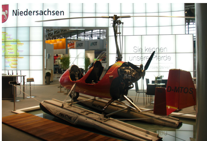
Der Tragschrauber der AutoGyro GmbH auf der HM 2008

Unternehmen (KMU) 3.300,00 € (netto) Unternehmen (Nicht-KMU) 8.300,00 € (netto)