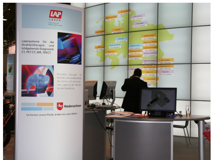
Arbeitsplatz mit hinterleuchteter Werbeplyone