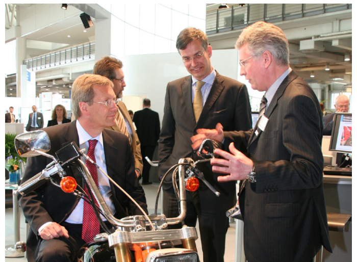
Ministerpräsident Christian Wulff im Gespräch mit Ausstellern