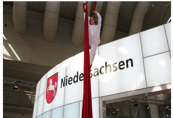
Sagenhafte Akrobaten weckten 2008 das Besucherinteresse an dem Gemeinschaftsstand.