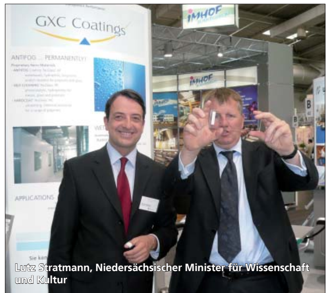
Lutz Stratmann, Niedersächsischer Minister für Wissenschaft und Kultur