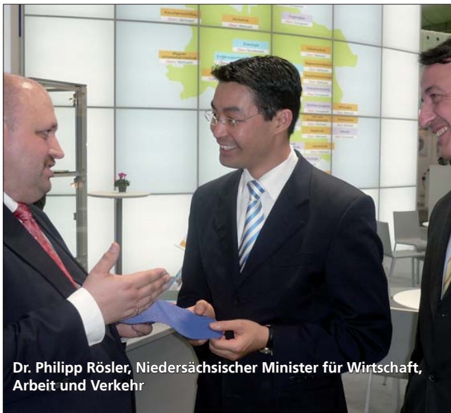
Dr. Philipp Rösler, Niedersächsischer Minister für Wirtschaft, Arbeit und Verkehr

Im Rahmen der HANNOVER MESSE 2009 wurde der Gemeinschaftsstand „Nano- und Materialinnovationen / Industrial Supply“ von Vertretern aus Politik, Wirtschaft und Verwaltung besucht.