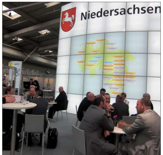
Gemeinschaftsstand HANNOVER MESSE 2009