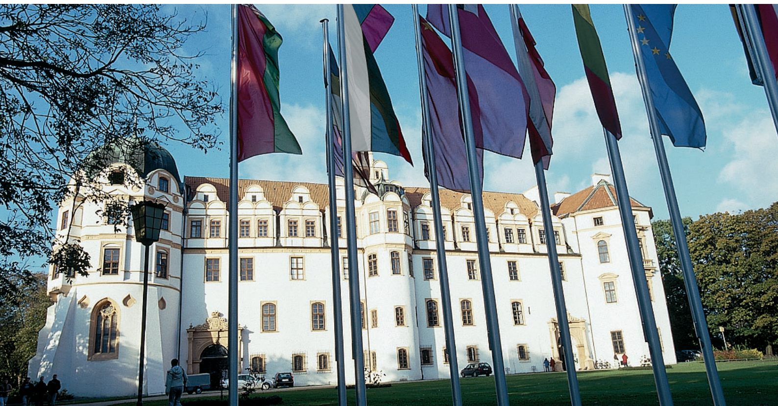
Немецкая Академия Менеджмента Нижней Саксонии в замке города Целле